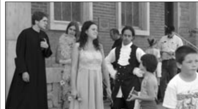
Acteurs de la maison des jeunes l'Ouvre-boîte et du Comité des citoyens et des citoyennes du quartier Saint-Sauveur en train de faire du théâtre de rue pour conscientiser les habitants aux problèmes d'aménagement dans leur quartier, pendant l'activité populaire « Saint-Sauveur en fête » le 31 août 2002.

Dans la deuxième phase de notre collaboration avec le CCCQSS, il a été convenu que notre aide serait de leur fournir des outils de développement durable et d'urbanisme en leur présentant des modèles d'aménagement et des exemples tels qu'on peut en retrouver dans la Trousse d'action Vers des collectivités viables ® . Notre but n'était pas de contrôler l'animation ou d'arriver avec une solution toute prête. Au contraire, nous nous sommes éloignés des consultations formelles avec la Ville dans le but de maintenir un lien privilégié avec le comité de citoyens et nous avons concentré notre énergie sur le dialogue, la perception du terrain, la compréhension des attentes et des besoins des citoyens, le transfert de connaissances et l'offre de modèles et d'exemples appropriés. Par exemple, s'il s'agissait pour Saint-Sauveur de planifier son aménagement en fonction du soutien au commerce et du développement du transport en commun, quelles seraient les caractéristiques du quartier Saint-Sauveur correspondant déjà un TOD (Transit Oriented Development)? Cette méthode