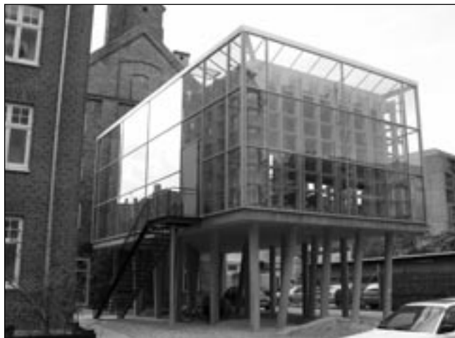
Maison de quartier construite récemment dans le quartier Holmbladsgade près de Copenhague, au Danemark. Un des exemples tirés de la Trousse d'action Vers des collectivités viables ® et présentés au Comité des citoyens et des citoyennes du quartier Saint-Sauveur lors des rencontres.