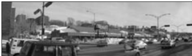
Vue panoramique du boulevard Charest Ouest au coin de Marie-de-l'Incarnation. Selon le point de vue, ce secteur peut être un désastre d'aménagement – véritable cicatrice urbaine – ou devenir un pôle de développement commercial conçu pour les piétons.